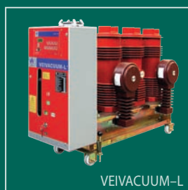
VEIVACUUM-L Вакуумный выключатель