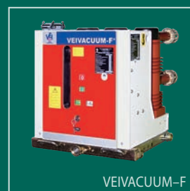
VEIVACUUM-F Вакуумный выключатель