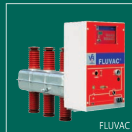
FLUVAC Вакуумный выключатель и разъединитель в элегазовой изоляции