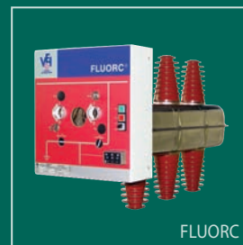
FLUORC Элегазовый выключатель нагрузки